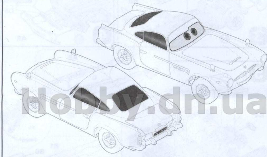
СХЕМА РАЗМЕЩЕНИЯ НАКЛЕЕК НА МОДЕЛИ